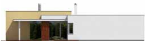
Pohled boční od terasy