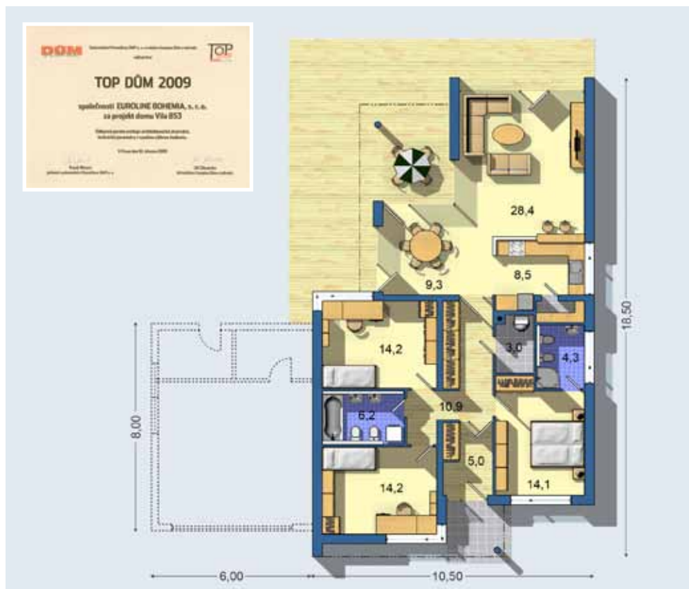
Projekt dodáván také s přistavěnou dvojgaráží a v zrcadlovém otočení