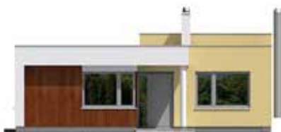
Pohled čelní s hlavním vstupem