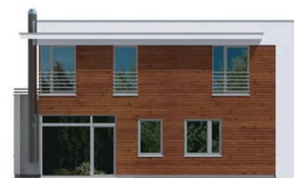
záhrada & bývanie