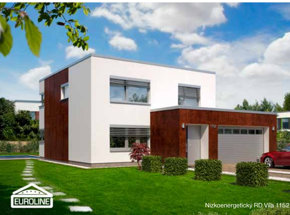
Nízkoenergetický RD Vila 1152

notka (obsahuje tep. čerpadlo vzduch – voda) s podporou solárního ohřevu vody a předohřevu přiváděného čerstvého vzduchu. Větrání je zabezpečeno mechanickým větráním s rekuperací tepla. Výrobu elektřiny zajišťuje 36 výkonných fotovoltaických článků. Doplnkovým zdrojem tepla je krbová vložka s bezroštovým ekologickým spalováním. V případě, že by dočasně fotovoltaika nevyrobila dostatek elektřiny, je dům napojen na klasickou elektrickou přípojku.