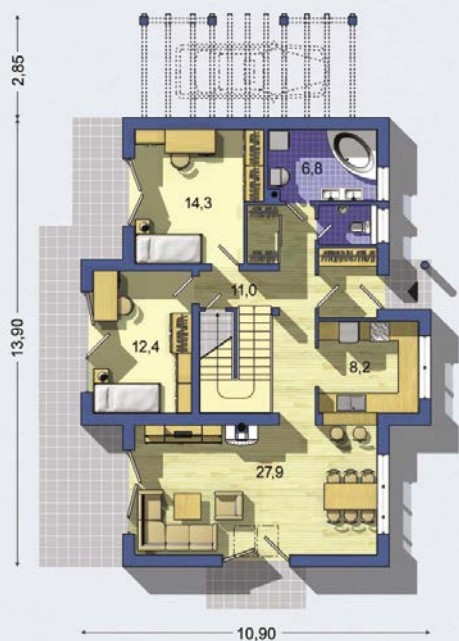
PŘÍZEMÍ [celková plocha 98.1 m 2 ]

prehledné členění dispozice na denní a noční část • čtyři pokoje s velkorysým hygienickým příslušenstvím, z toho dva v přízemí • předností domu jsou pohodlné podkrovní pokoje s vysoko posazeným krovem • těžiště přízemí tvoří obytný velkoprostor se zvýšeným stropem a průhledem do krovu a s centrálně umístěným krbem • hlavní obytný prostor je částečně propojený s kuchyní • přímá návaznost všech obytných místností na terasu nebo balkon • možnost vybudování krytého přístřešku pro automobil • kompaktní dispozice spojená se zateplením stěn přispívá k úspoře energií • zajímavý vzhled umožňuje umístění domu do městského i venkovského prostředí • • •