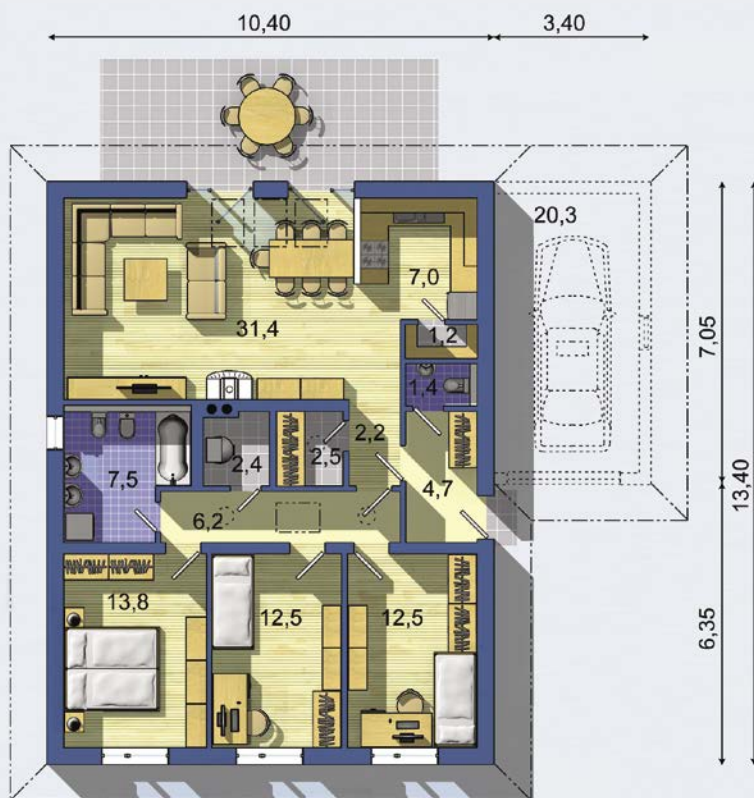
PŘÍZEMÍ [celková plocha 105.4 m 2 ]

Návrh dispozice půdorysu rodinného domu je architektonickým dílem podle § 2 odst.1 Autorského zákona č. 121/2000 Sb. Jeho porušení je trestné podle § 270 Trestního zákoníku č. 40/2009 Sb.