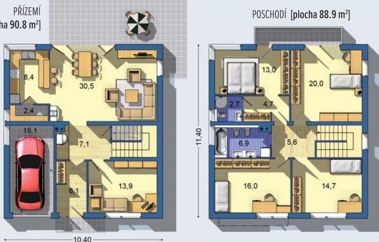
POSCHODÍ [plocha 88.9 m 2 ]