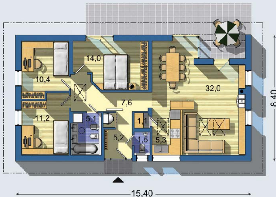
PRÍZEMÍ [celková plocha 92.7 m 2 ]

Návrh dispozice půdorysu rodinného domu je architektonickým dílem podle § 2 odst.1 Autorského zákona č. 121/2000 Sb. Jeho porušení je trestné podle § 270 Trestního zákoníku č. 40/2009 Sb.