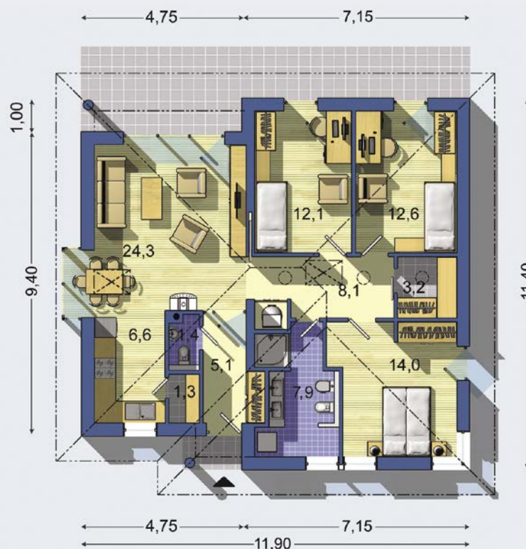
PŘÍZEMÍ [celková plocha 96.4 m 2 ]

Návrh dispozice půdorysu rodinného domu je architektonickým dílem podle § 2 odst.1 Autorského zákona č. 121/2000 Sb. Jeho porušení je trestné podle § 270 Trestního zákoníku č. 40/2009 Sb.