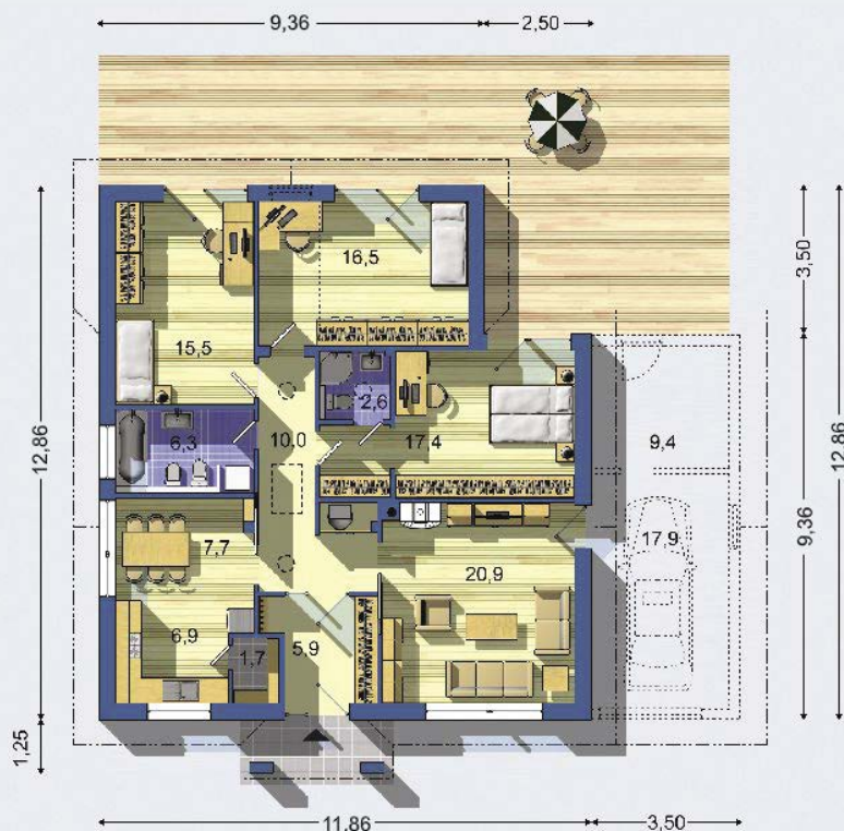
PŘÍZEMÍ [celková plocha 111.4 m 2 ]

Návrh dispozice půdorysu rodinného domu je architektonickým dílem podle § 2 odst.1 Autorského zákona č. 121/2000 Sb. Jeho porušení je trestné podle § 270 Trestního zákoníku č. 40/2009 Sb.