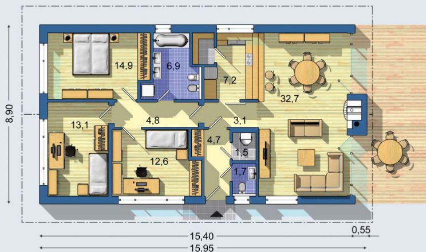
PŘÍZEMÍ [celková plocha 104.7 m 2 ]

BUNGALOV 1375 - moderní dům vhodný i na užší parcely - jednoduchá dispozice s minimálním podílem chodeb - dokonale oddělená noční část s velkou koupelnou - komfortní kuchyni částečně včleněnou do hlavního obytného prostoru je možné stavebně úplně oddělit - samostatná technická místnost u vchodu - jednoduchý tvar zastřešení - úsporné řešení bez stropní konstrukce se zavěšeným sádkartonovým podhledem - atraktivní vzhled s velkými zasklenými plochami a zvýšeným prostorem nad obývacím pokojem - dům je možné umístit delší nebo kratší stranou k ulici . . .