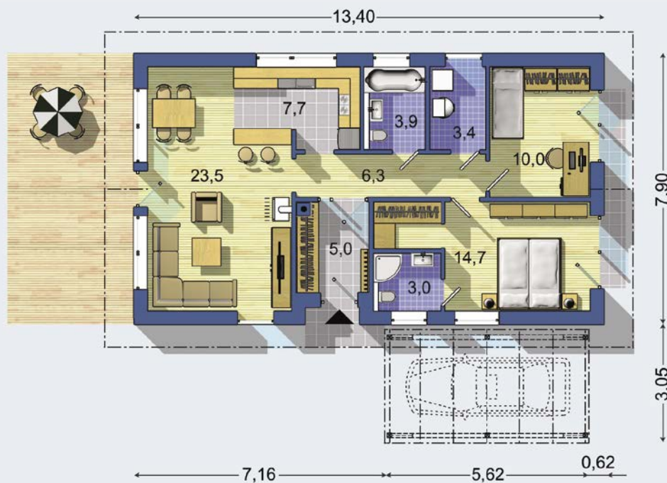
PŘÍZEMÍ [celková plocha 77.3 m 2 ]

Návrh dispozice půdorysu rodinného domu je architektonickým dílem podle § 2 odst.1 Autorského zákona č. 121/2000 Sb. Jeho porušení je trestné podle § 270 Trestního zákoníku č. 40/2009 Sb.