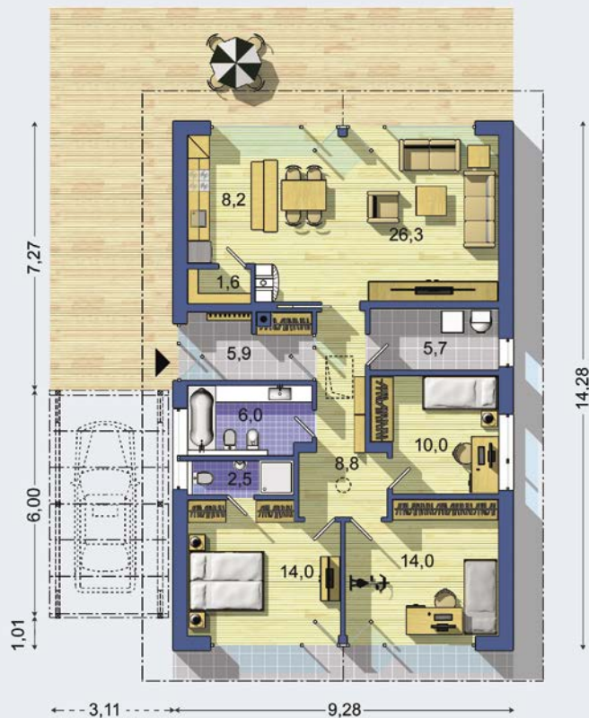
PŘÍZEMÍ [celková plocha 103.0 m 2 ]

Návrh dispozice půdorysu rodinného domu je architektonickým dílem podle § 2 odst.1 Autorského zákona č. 121/2000 Sb. Jeho porušení je trestné podle § 270 Trestního zákoníku č. 40/2009 Sb.