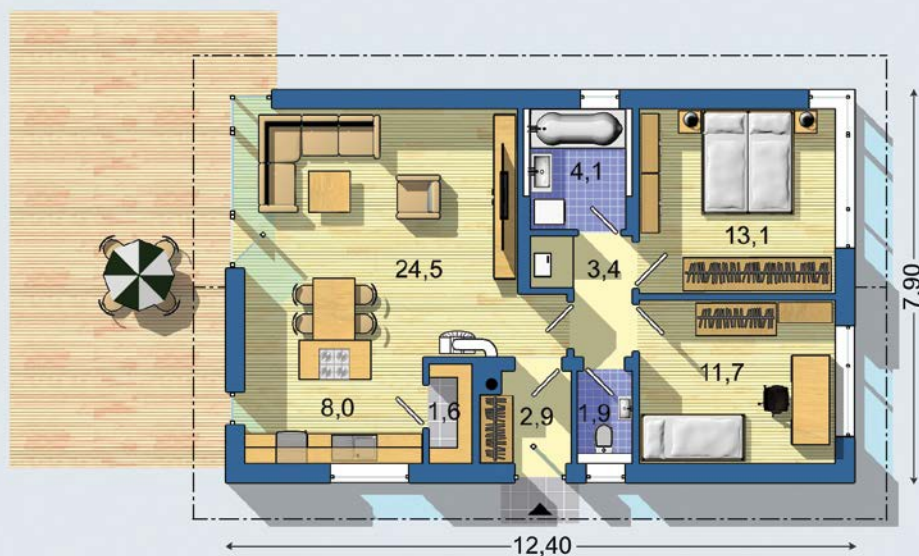
PŘÍZEMÍ [celková plocha 71.2 m 2 ]

Návrh dispozice půdorysu rodinného domu je architektonickým dílem podle § 2 odst.1 Autorského zákona č. 121/2000 Sb. Jeho porušení je trestné podle § 270 Trestního zákoníku č. 40/2009 Sb.