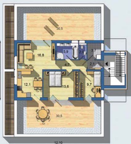
POSCHODÍ [celková plocha 133.6 m 2 ]

Způsob vytápění: podlahové vytápění Zdroj: tepelné čerpadlo / plynový kotel