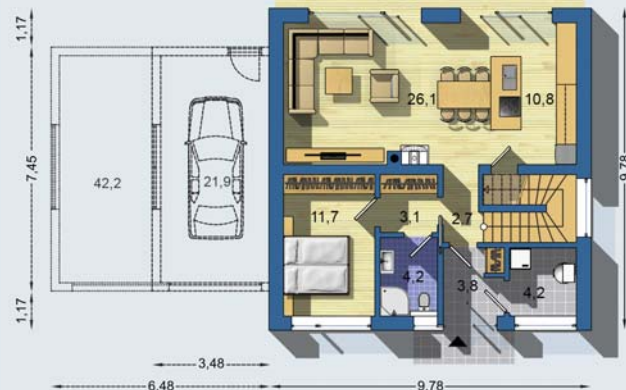
PŘÍZEMÍ [celková plocha 74.7 m 2 ]

Návrh dispozice půdorysu rodinného domu je architektonickým dílem podle § 2 odst.1 Autorského zákona č. 121/2000 Sb. Jeho porušení je trestné podle § 270 Trestního zákoníku č. 40/2009 Sb.