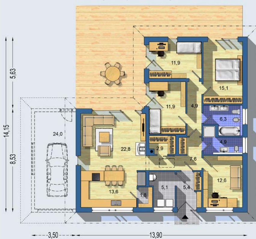
PŘÍZEMÍ [celková plocha 127.0 m 2 ]

Návrh dispozice půdorysu rodinného domu je architektonickým dílem podle § 2 odst.1 Autorského zákona č. 121/2000 Sb. Jeho porušení je trestné podle § 270 Trestního zákoníku č. 40/2009 Sb.