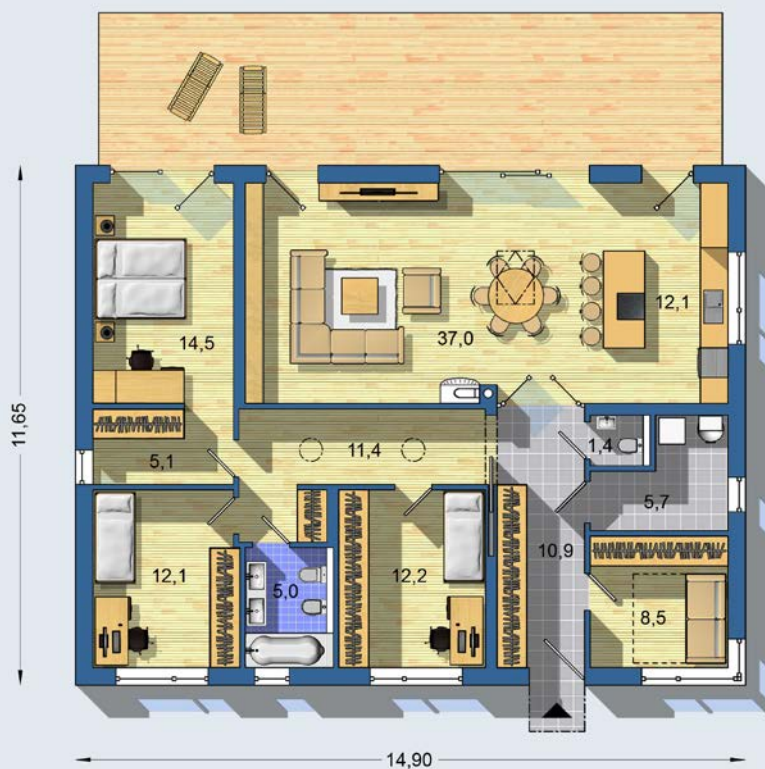
PŘÍZEMÍ [celková plocha 136.7 m 2 ]

Návrh dispozice půdorysu rodinného domu je architektonickým dílem podle § 2 odst.1 Autorského zákona č. 121/2000 Sb. Jeho porušení je trestné podle § 270 Trestního zákoníku č. 40/2009 Sb.