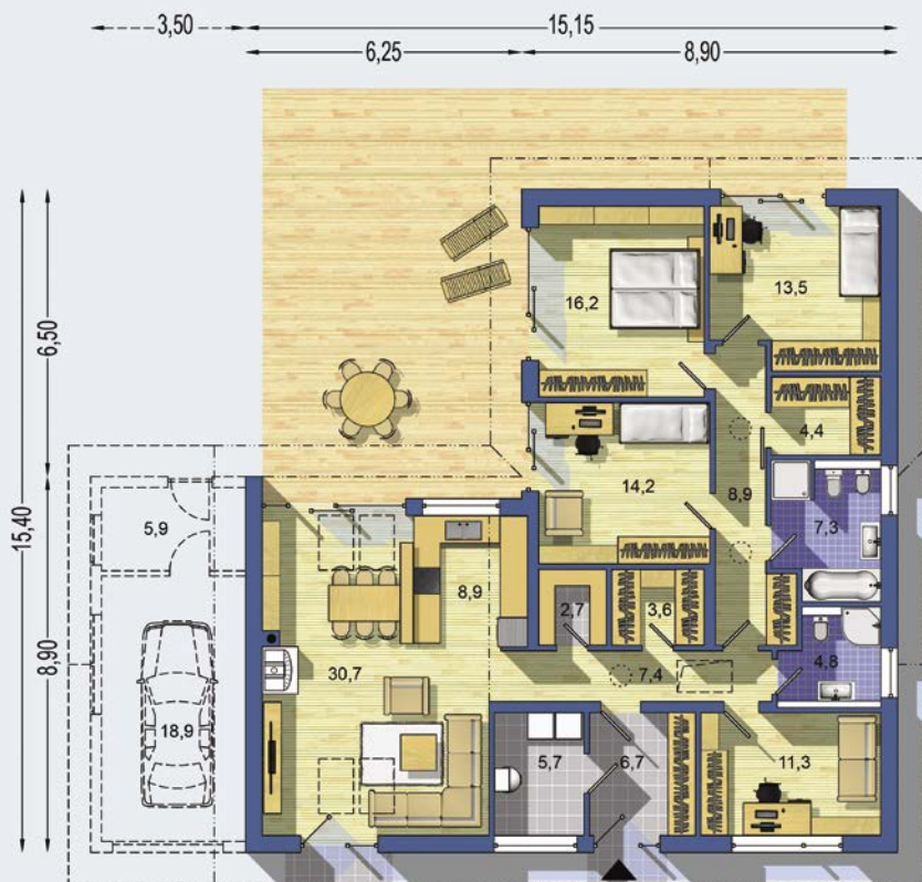
PŘÍZEMÍ [celková plocha 146.3 m 2 ]

Návrh dispozice půdorysu rodinného domu je architektonickým dílem podle § 2 odst.1 Autorského zákona č. 121/2000 Sb. Jeho porušení je trestné podle § 270 Trestního zákoníku č. 40/2009 Sb.