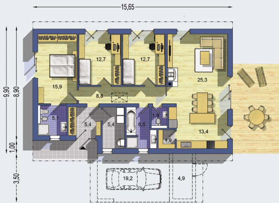
PŘÍZEMÍ [celková plocha 114.9 m 2 ]

Návrh dispozice půdorysu rodinného domu je architektonickým dílem podle § 2 odst.1 Autorského zákona č. 121/2000 Sb. Jeho porušení je trestné podle § 270 Trestního zákoníku č. 40/2009 Sb.