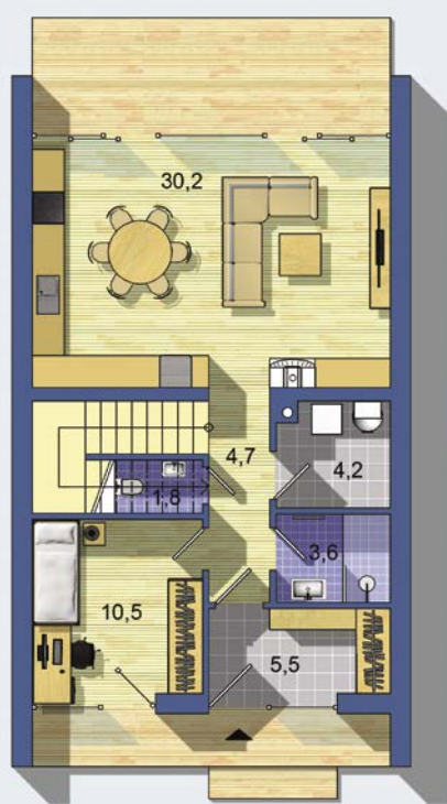
PŘÍZEMÍ [celková plocha 60.4 m 2 ]