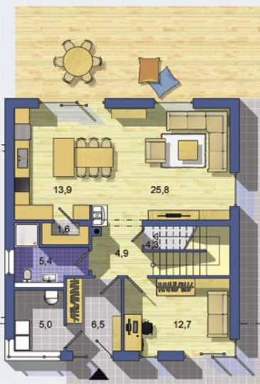
POSCHODÍ [celková plocha 74.9 m 2 ]