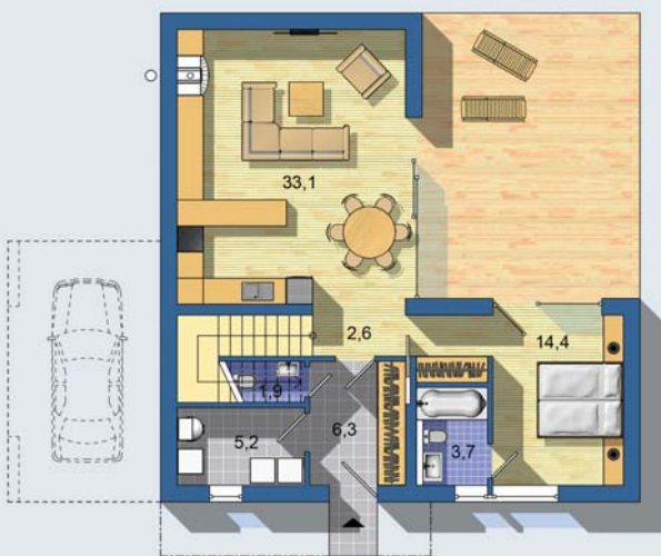
PŘÍZEMÍ [celková plocha 67.2 m 2 ]