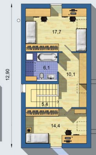
POSCHODÍ [celková plocha 53.6 m 2 ]